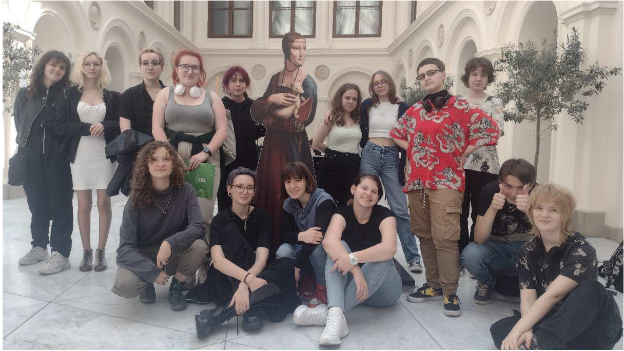
Potem udaliśmy się do Arsenалу , w którym podziwialiśmy sztukę starożytną