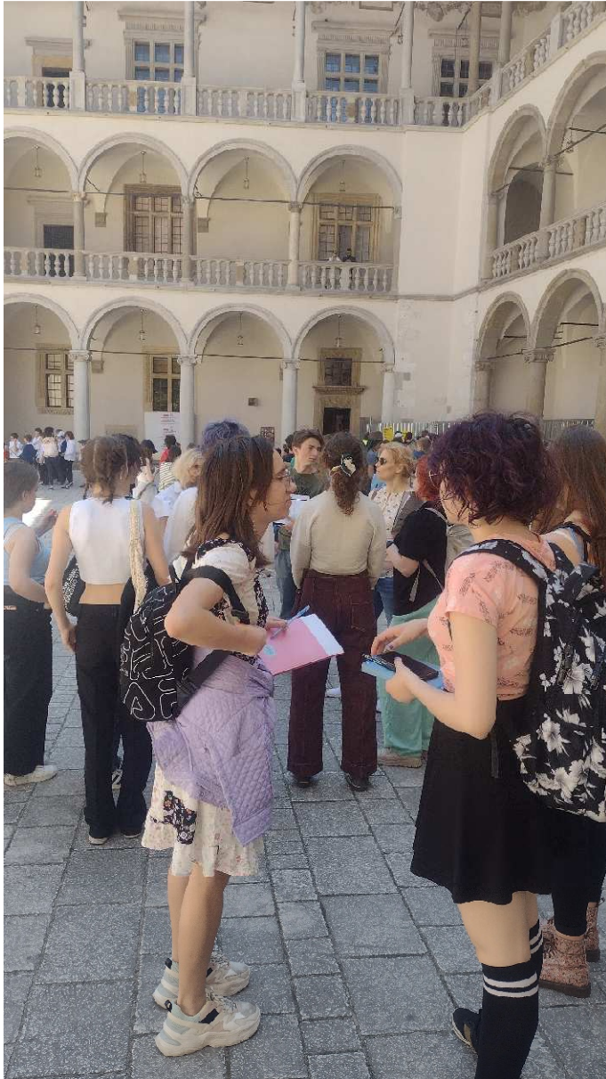
Oraz Muzeum Wawel Odzyskany